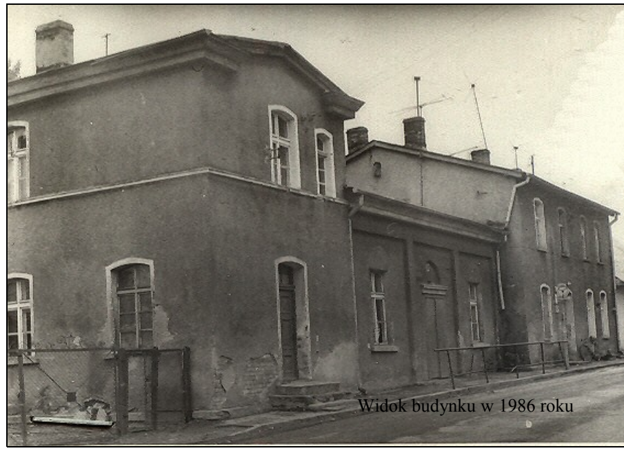
Widok budynku w 1986 roku