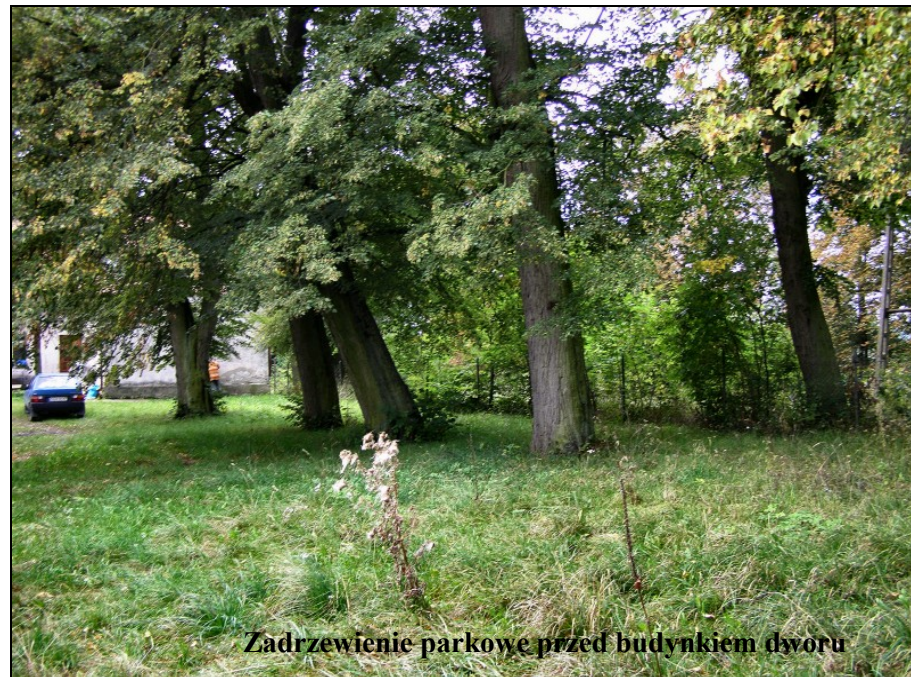
Zadrzewienie parkowe przed budynkiem dworu