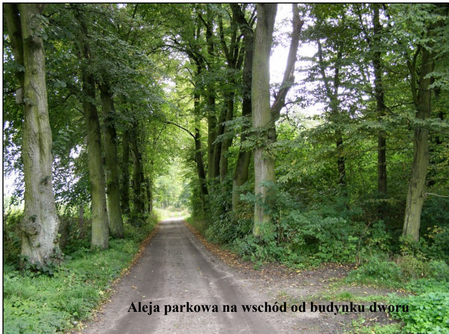
Aleja parkowa na wschód od budynku dworu