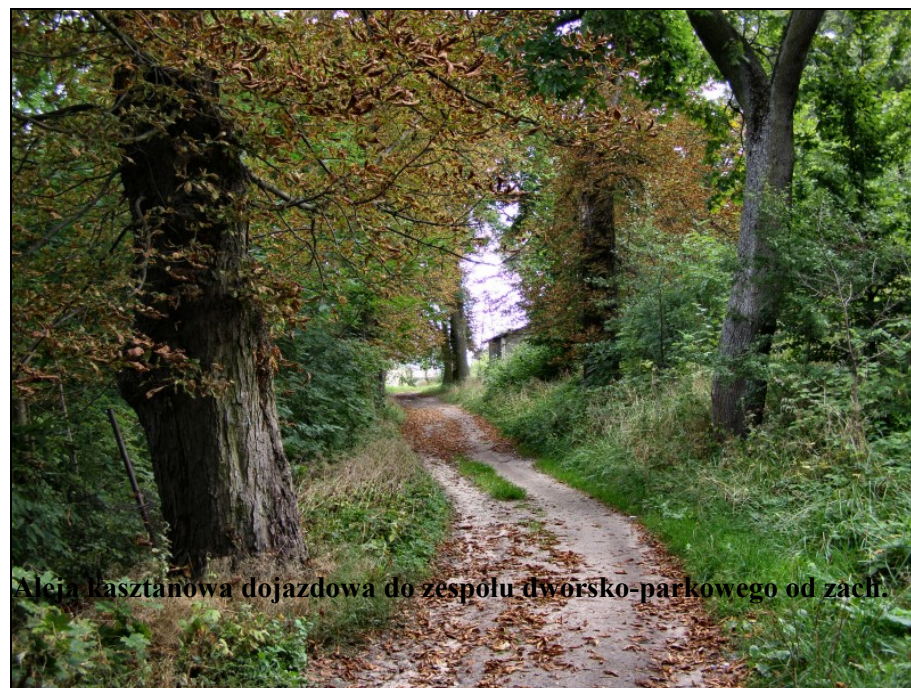
Aleja kasztanowa dojazdowa do zespołu dworsko-parkowego od zach.