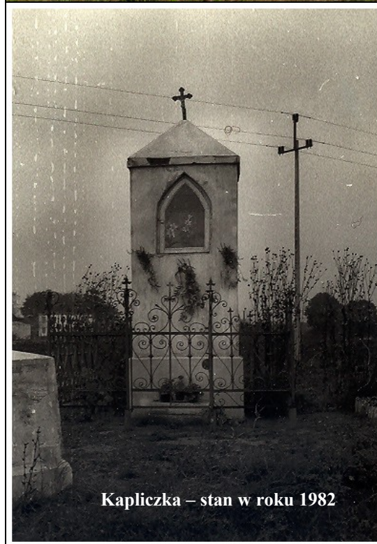
Kapliczka – stan w roku 1982