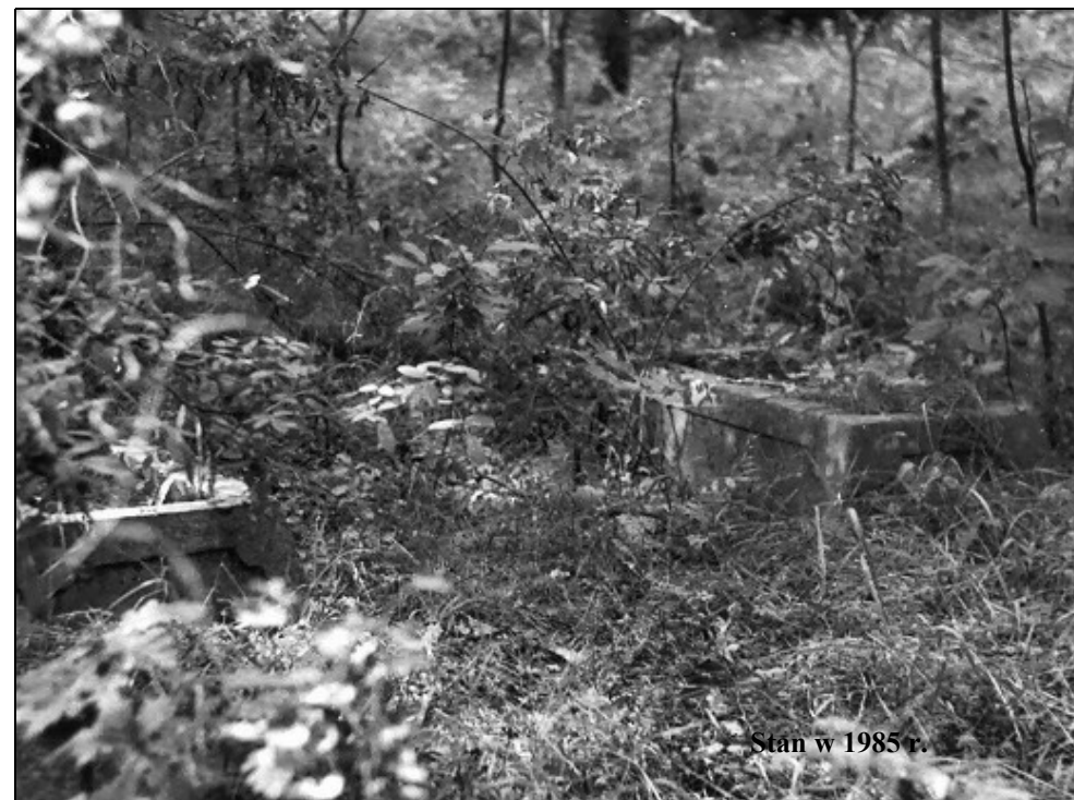
Stan w 1985 r.