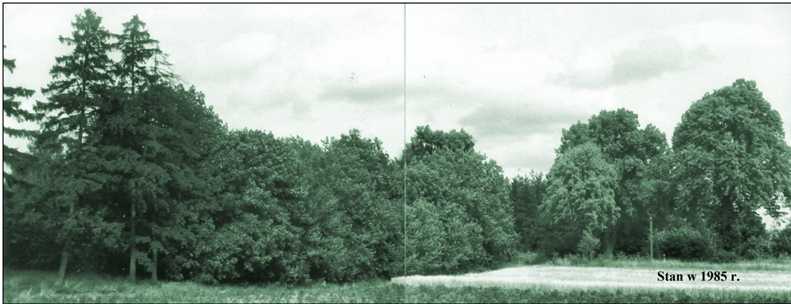
Stan w 1985 r.