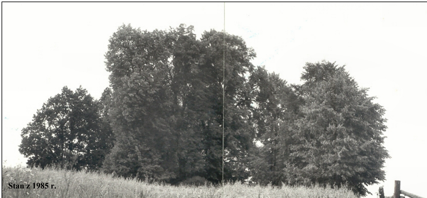
Stan z 1985 r.