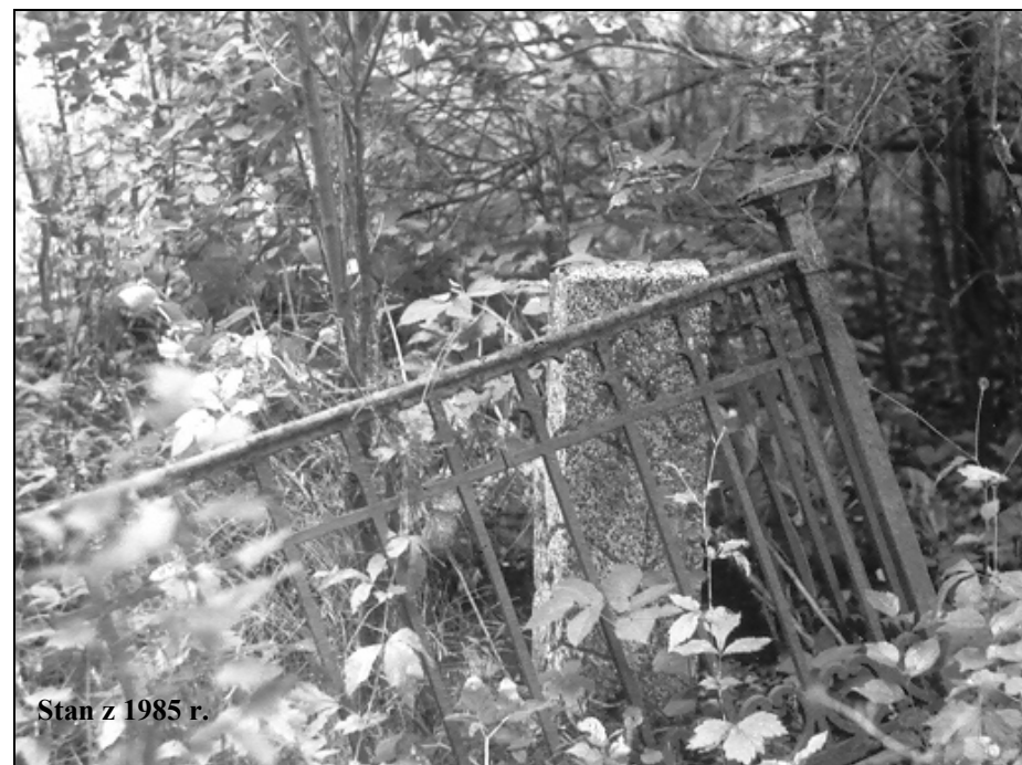
Stan z 1985 r.