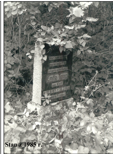
Stan z 1985 r.